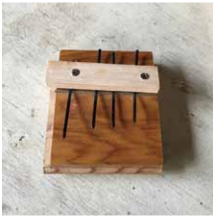
ヘアピンの長さで音階が変わります。

ともにつくる ともにそだてる ともにたべる ともにあそぶ ともにすごす ともにたのしむ