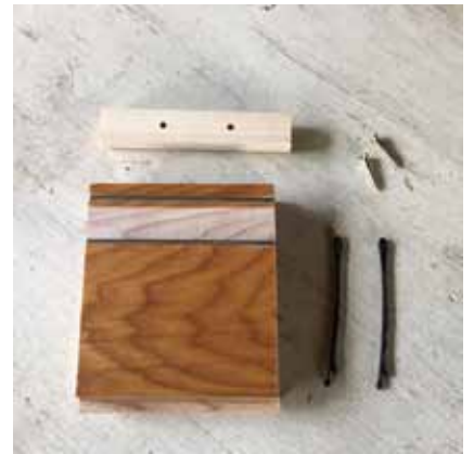
材料はこれだけです。

ともにつくる ともにそだてる ともにたべる ともにあそぶ ともにすごす ともにたのしむ